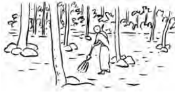
โผดงพลาทอน, โชน