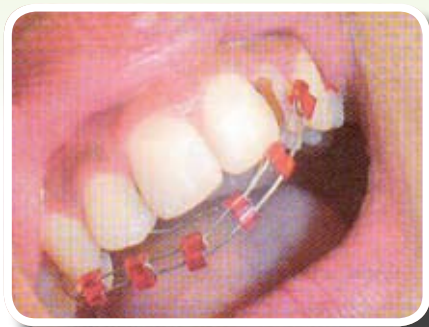
ลวดเหล็ก

หนูเห็นเค้ามี่ตั้งโต๊ะรับจัดฟันแพชั่นด้วยนะคะ