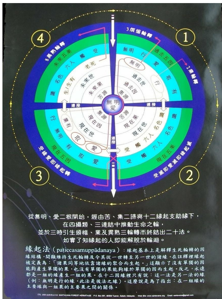
表源自马来西亚沙巴州寂静禅林(Santavana)

我们对这些四圣谛法必须遍知，遍断，遍证，遍修方能出离三界。故佛说他要是对于四谛没有进行三转十二行彻底的断除一切结缚的话，他不能称为正遍知，和正等正觉者。这里所讨论的三种遍知都是道智的作用，知遍知也叫随觉智 ( anubodha ñana )，度遍知与断遍知也叫做通达智 ( pativedha ñana )。