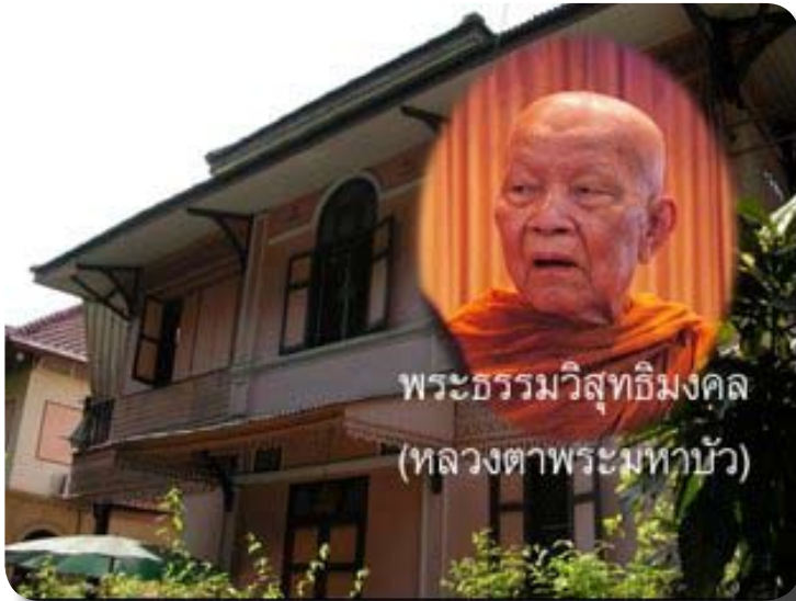
ภูมิดำรงนุกูล เคยเป็นที่พำนักของ หลวงตามหาบัว ญาณสมฺปนฺโน

เยี่ยมที่ภูมิด้วย ยังมีปริศนาที่ปรากฏในประวัติหลวงตาที่ว่า ในเวลาเรียนท่านนั่งสมาธิเดินจงกรมภาวนาด้วย แล้วทางที่ท่านจงกรรมนั้นอยู่ที่ตรงไหน?