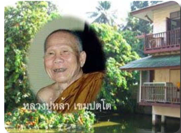
กุฏิบ่อเต่า เคยเป็นที่พำนักของ หลวงปู่หล้า เขมปัตโต

เปิดพระอุโบสถให้ มีเกร็ดอีกนิดหนึ่งถ้าเข้ามาในเขตพระอุโบสถแล้ว ลองสังเกตดูดี ดีแปดเขียนอธิการมีจริง!