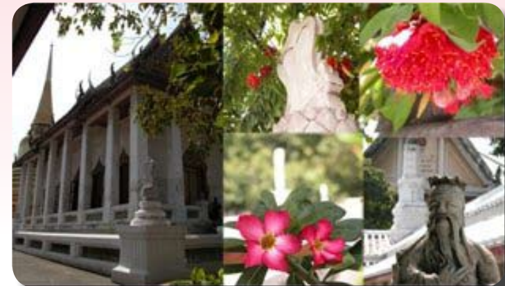
พระอุโบสถ วัดบรณนิवास

ในฉบับที่แล้ว ผู้เขียนได้กล่าวถึงประวัติและความสำคัญของวัดบรณนิवासโดยย่อ และได้พาชมสถานที่บางส่วนของวัด ในฉบับนี้ ผู้เขียนขออนุญาตพาชมวัดบรณนิवास ต่อไป