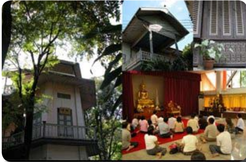
(ซ้าย) หอมราภิรมย์ (บนขวา) ภูมิปัทมราช (ล่างขวา) กิจกรรมศูนย์อบรมภวนาสิริจันโท