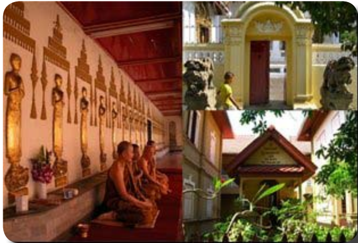
[ซ้าย] ภายในพระวิหารรายมีพระอริยสวาท ๘๐ รูป [ขวา] ภูมิกรรมฐาน

พระเจดีย์ เป็นที่ประดิษฐานรูปปูนปั้นนูนต่ำพระอริยสวาท ๘๐ รูปในอิริยาบถ ยืนนมัสการพระเจดีย์ ยังมีผู้สังเกตได้ว่า พระสาวกเหล่านี้กำลังเดินจงกรมแสดงถึงจุด ประสงค์ของวัดที่เป็นวัดฝ่ายปฏิบัติ บริเวณด้านหน้าพระสาวกเหล่านี้ ก็ยังเหมาะสม กับการเดินจงกรมอีกด้วย