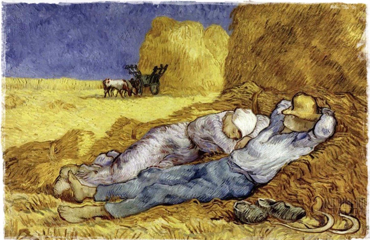
ภาพชื่อ Noon: Rest from Work โดย Vincent van Gogh

ในวิชาที่เราเรียนและสอนกันในภาควิชาปรัชญาทั่วโลกนั้น มีวิชาอยู่วิชาหนึ่ง เรียกกันในภาษาไทยว่า “ปรัชญาภาษา” เนื่องจากคำไทยที่ว่านี้มีคำในภาษาอังกฤษอย่างน้อยอยู่สองคำที่เราถือกันว่าเป็นที่มาของคำว่า “ปรัชญาภาษา” ในภาษาไทย และสองคำในภาษาอังกฤษนี้ก็มีความหมายต่างกัน ผมจึงใคร่ขอเริ่มต้นที่คำภาษาอังกฤษสองคำนี้ก่อน คำแรกคือ ‘Linguistic Philosophy’