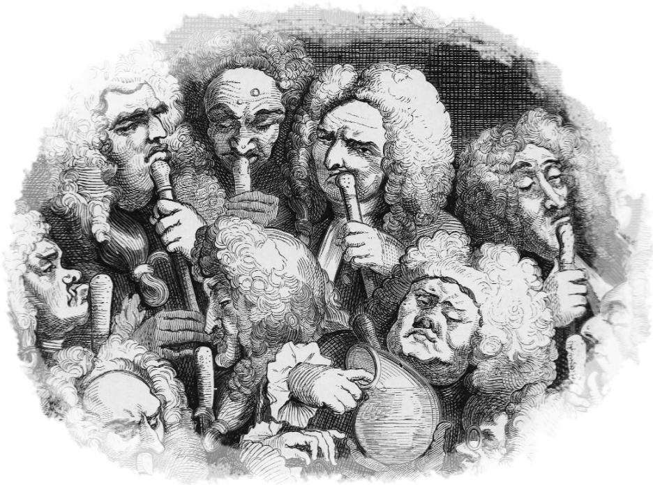
ภาพชื่อ Arms of the Undertakers โดย William Hogarth